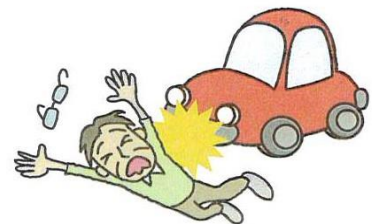
●PTA行事後、帰宅途中に車にはねられてケガをした。