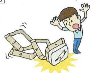
●PTAの運動大会で使用するために借用したスポーツ用具をあやまって落とし破損させた。