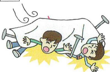
●PTAの催しで会場設備の不備により来場者がケガをした。