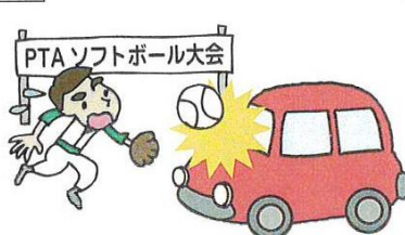
●PTA主催のソフトボール大会で打球が走行中の第三者の車にあたり損傷させた。