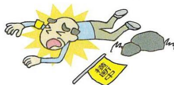
●PTA活動として行った登下校の安全指導中にケガをした。